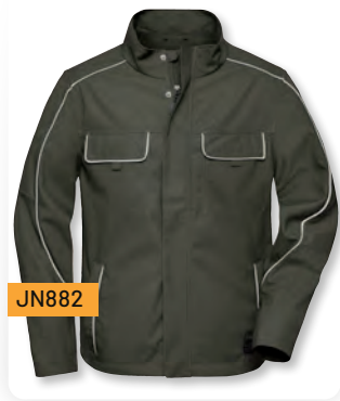
WORKWEAR SOFTSHELL LIGHT JACKET - SOLID -