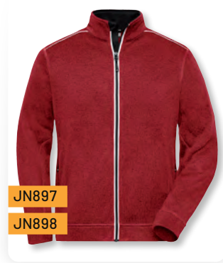
LADIES' • MEN'S KNITTED WORKWEAR FLEECE JACKET - SOLID -